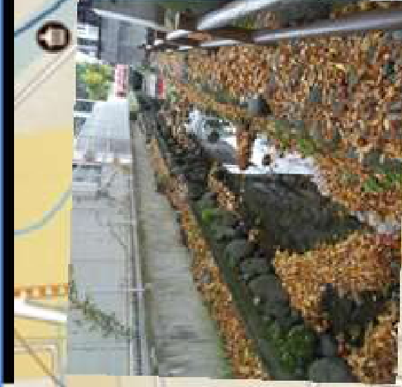
手エツクボイノト① ハケ郷 堰神社