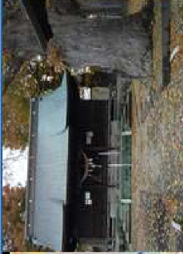
手エツクボイノト② 神明 神社