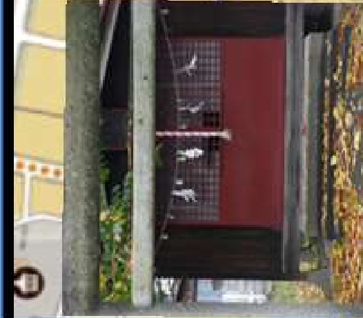
手エツクボイノト③ 稲荷 神社